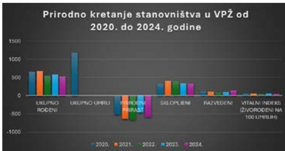
Grafikon 2. : Prirodno kretanje stanovništva Virovitičko-podravске županije od 2020.-2024. godine

Izvor: DZS, Priopćenje od 18.07.2025. godine, ISSN 1334-0557