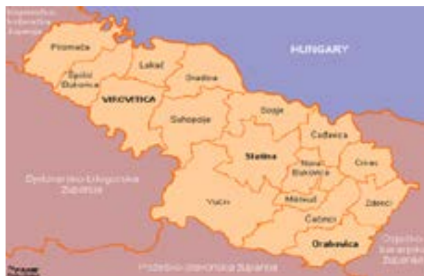
Slika 1: Teritorijalno-administrativni ustroj Virovitičko-podravске županije

Virovitičko-podravska županija administrativno je podijeljena na tri grada i trinaest općina. Gradovi Virovitica, Oraševica i Slatina glavni su urbani centri, pri čemu je Virovitica sjedište županije. Općine uključuju Crnac, Čačinci, Čadavicu, Gradinu, Lukač,