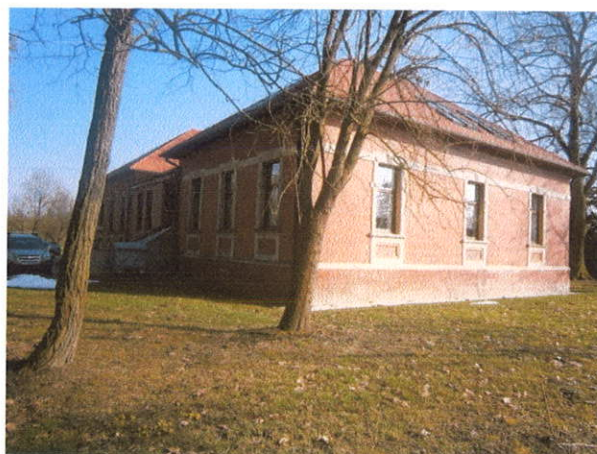
IZGLED IZVANA JUGO ZAPAD