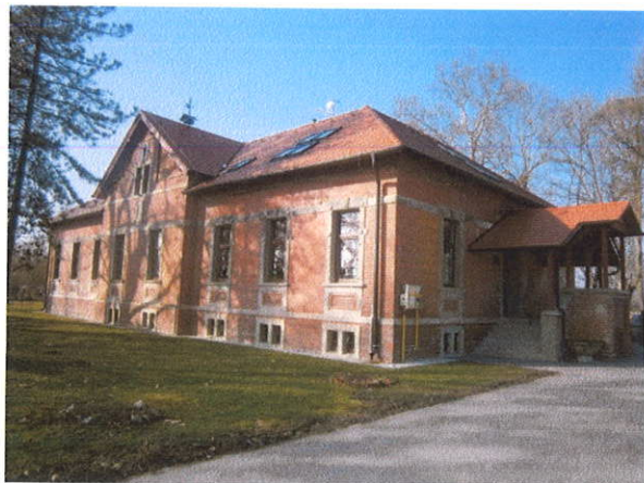
IZGLED IZVANA SJEVERO ISTOK