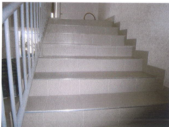
STEPENICE ZA POTKROVLJE