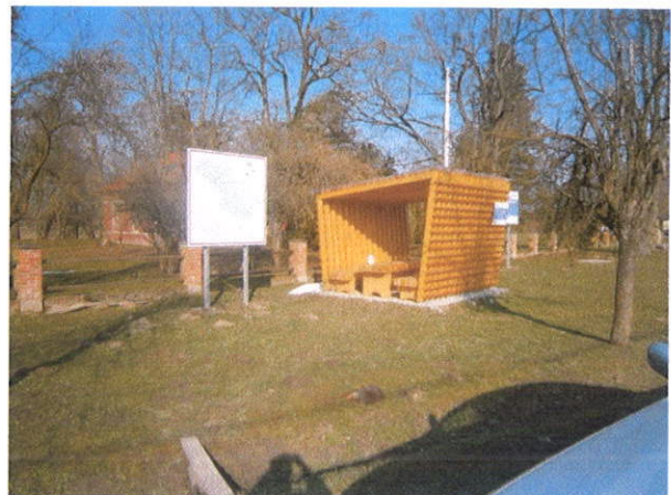
ULAZ U DVORIŠTE