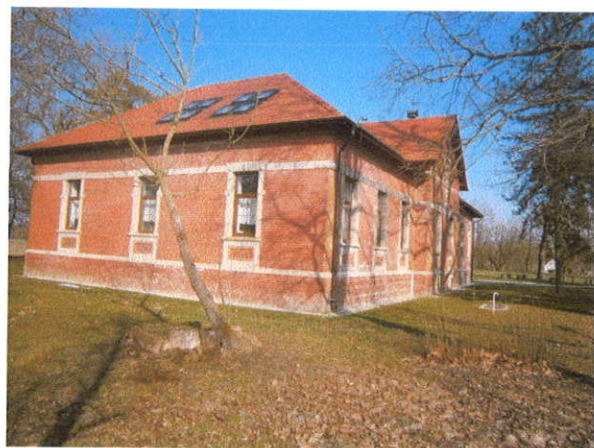
IZGLED IZVANA JUGO ISTOK