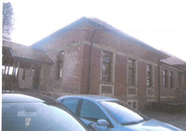
IZGLED IZVANA SJEVERO ZAPAD