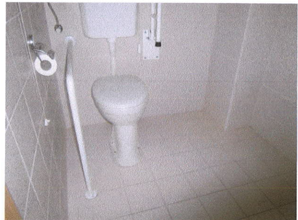
PRIZEMLJE WC INVALIDI