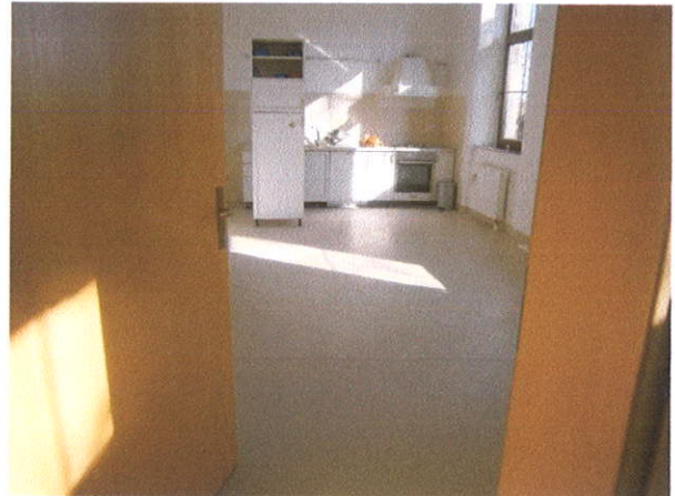
PRIZEMLJE – KUHINJA