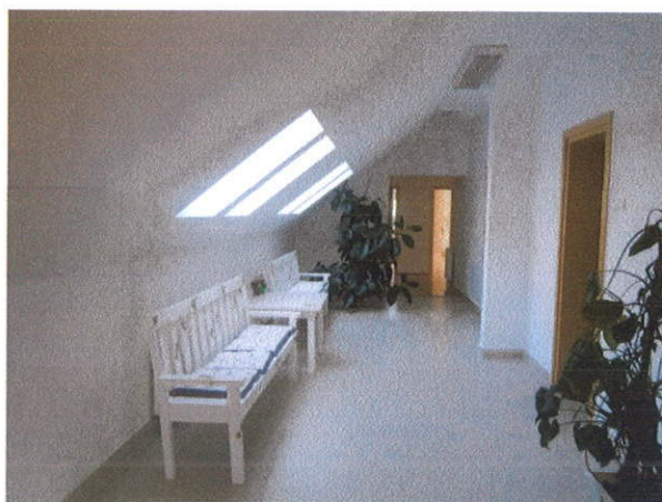
POTKROVLJE - HODNIK