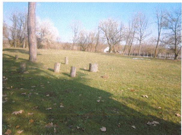
PARK ISPRED OBJEKTA