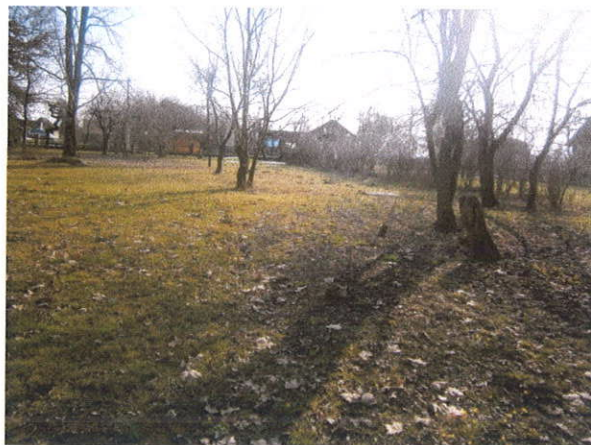
K.Č. 288 I 290